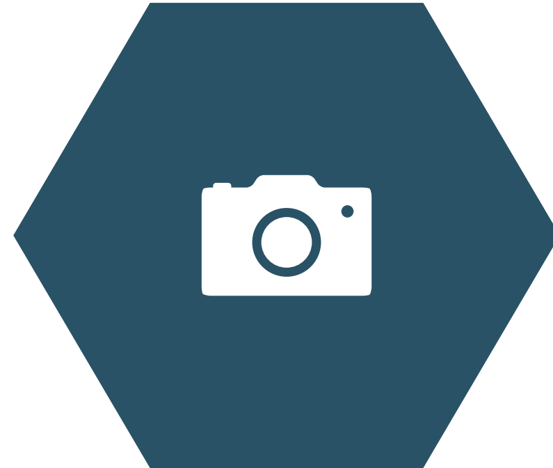
Foto- und Videoshooting

Wir planen monatlich relevante Themen ein, setzen einen sinnvollen Redaktionsplan auf und überlegen uns Ideen zur Umsetzung.